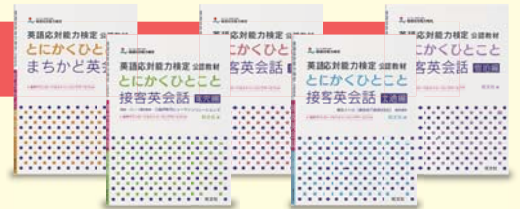
英語対応能力検定。公認教材 とにかくひとことまちかど英会話 / とにかくひとこと接客英会話 (販売編/飲食編/宿泊編/交通編)

店舗・飲食店、宿泊施設・交通サービスで使える英語対応表現を学習。 接客中に外国人に話しかけられたときに対応できる英語表現を場面別に、3ステップで学べます。